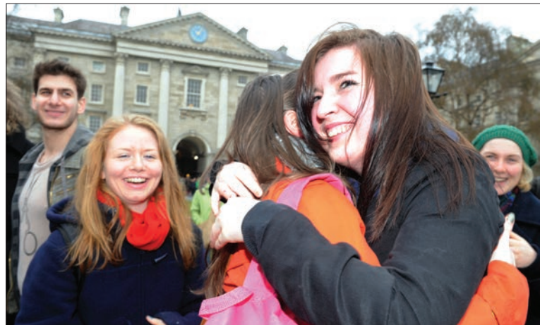
Ceiliúradh tar éis a bheith tofa mar Scoláire

Is institiúid de chuid an Choláiste í an Scoláireacht Fondúireachta a bhfuil stair fhada agus ardghradam ag baint léi, agus is gné shainiúil í de shaol na mac léinn i gColáiste na Tríonóide. Is é an cuspóir atá ag an scrúdú don Scoláireacht Fondúireachta ná mic léinn a aithint atá, ag leibhéal measúnuithe atá feiliúnach don Chéad Bhliain Sinsearach, ábalta a léiriú go seasta go bhfuil eolas agus tuiscint eisceachtúil acu ar a gcuid ábhar. Tá scoláireacht i gColáiste na Tríonóide fós ar an ngradam fochéime is mó sa tír a mbaineann gradam leis, agus is gradam é gan amhras ar bith a chuidigh le naisc a mhair i bhfad a chothú idir go leor sárchéimithe agus an Coláiste. Ar cheann de phríomhchuspóirí Choláiste na Tríonóide tá sármhaitheas a thóraíocht: tá institiúid na Scoláireachta ar cheann de na taispeántais inlámhsithe is mó díobh seo.