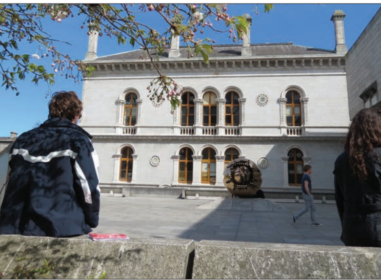
Foirgneamh an Mhúsaeim