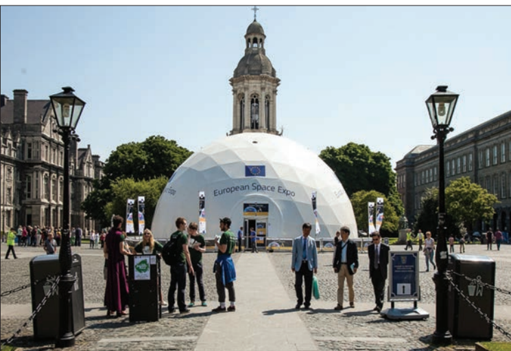
An Space Expo Dome sa Chearnóg Tosaigh a tharraing 30,000 cuairteoir

Thug thart ar 30,000 duine cuairt ar an European Space Expo fad a bhí sé lonnaithe i gColáiste na Tríonóide i mí Meitheamh 2013 áit ar tugadh deis dóibh taithí a fháil ar an iontas atá sa spás trí thaispeántais idirghníomhacha agus foghlaim faoin tslí is féidir le heolaíocht spáis a bheith chun leasa gach duine.